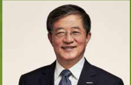
Jianxin Ren Presidente

Esperamos que comprendan y actúen conforme al objeto, los valores y el Código de Conducta de nuestra compañía, y que expresen su opinión cuando crean que podemos hacer las cosas de una mejor manera. Al trabajar como un equipo para alcanzar los mismos y ambiciosos estándares éticos, todos podremos estar orgullosos del trabajo que hacemos, de cómo lo hacemos y de nuestra contribución a los agricultores y a la sociedad.